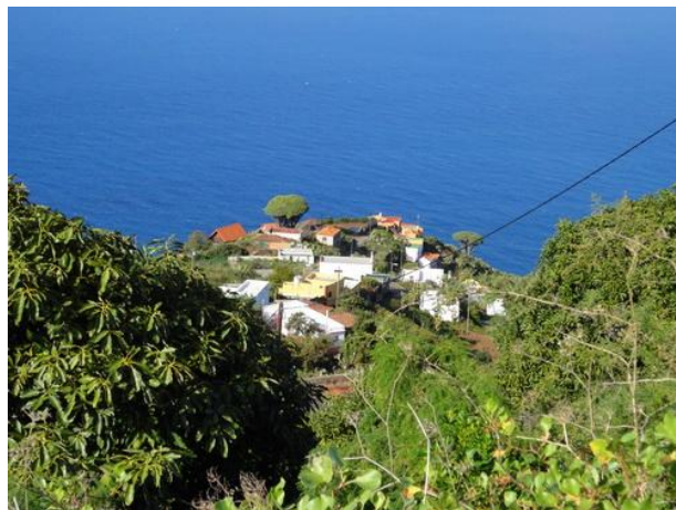
Blick auf El Tablado ganz im Norden von La Palma

Die ersten fünf Nächte verbringen wir in einem kleinen Stadthotel in der heimlichen Inselhauptstadt Los Llanos de Aridane im fruchtbaren Aridanetal im Zentrum der Insel. Der Ort hat viel Ambiente und ist der ideale Ausgangspunkt für viele klassische Wanderrouten. Zum Baden ist es