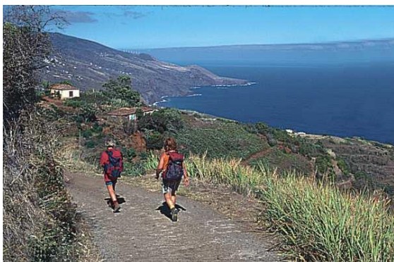
Wandern mit weitem Blick über das Meer

„La Isla Bonita“, die schöne Insel wird La Palma wohl auch genannt, weil sie so grün ist. Ausgedehnte Kiefern- und Lorbeerwälder mit vielen Bächen prägen die Insel ebenso wie die weiten Bergregionen. Faszinierendes Zentrum ist der Nationalpark Caldera de Taburiente, ein mächtiger Krater von mehr als zehn Kilometern Durch-